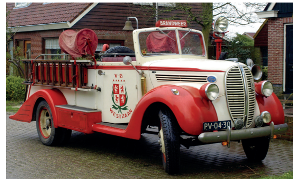
De Ford V8 brandweewagen, klaar voor deelname aan een oldtimerevenement, ca. 1985.