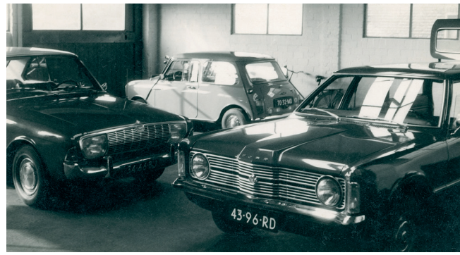
In de garage een Ford Taunus 17M (links), Ford Taunus 1300 en een Mini, ca. 1960.