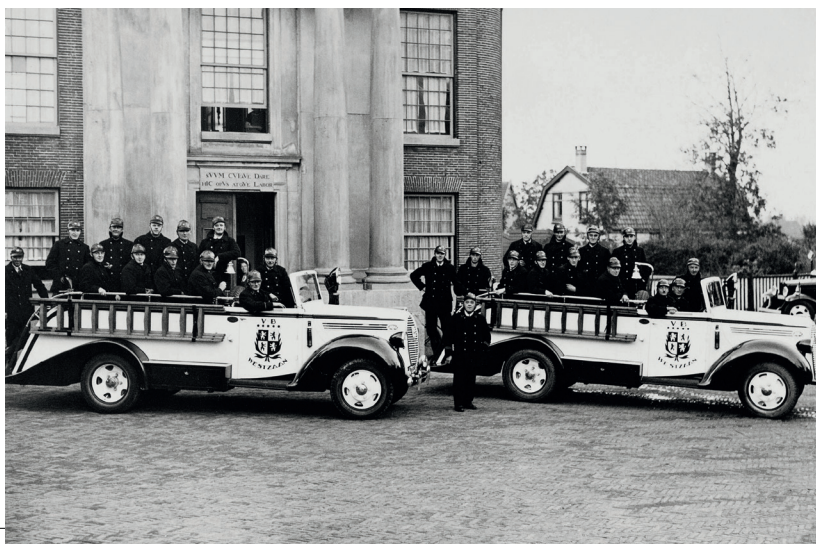
Twee nieuwe autospuitten voor de Westzaanse brandweer, 29 oktober 1938.