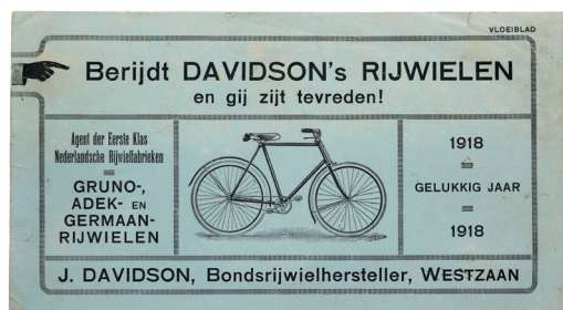
Reclamevloei- blad annex nieuwjaars- wens 1918.

Begin jaren dertig beschikt Davidzon over twee tweedehands autobussen voor het vervoer van plaats- en streekgenoten naar elke gewenste plek. Lies fungeert vanaf de latere jaren dertig ook als taxichauffeuse.