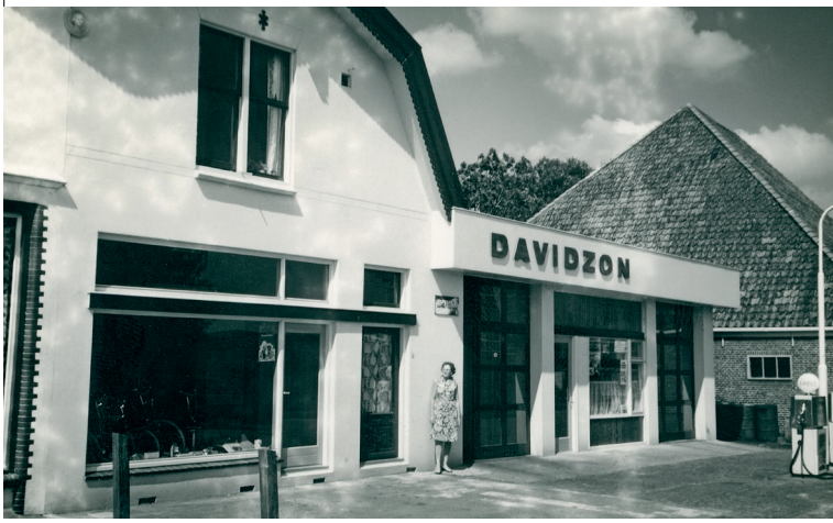
Lies Davidzon poseert bij de in opdracht van Shell gemoderniseerde gevel, 1970.