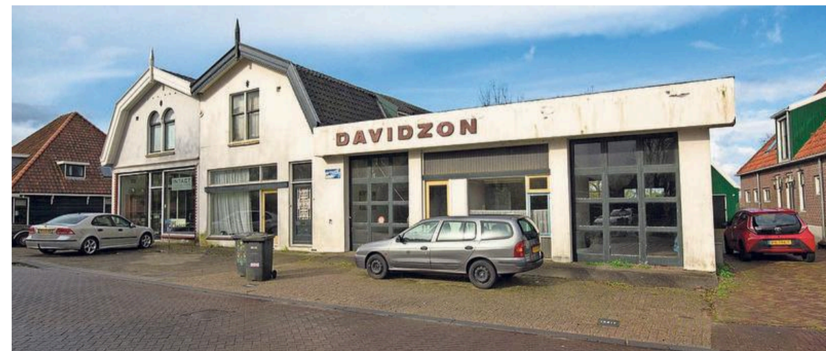
Garagebedrijf Davidzon en het woonhuis aan de J.J. Allanstraat.