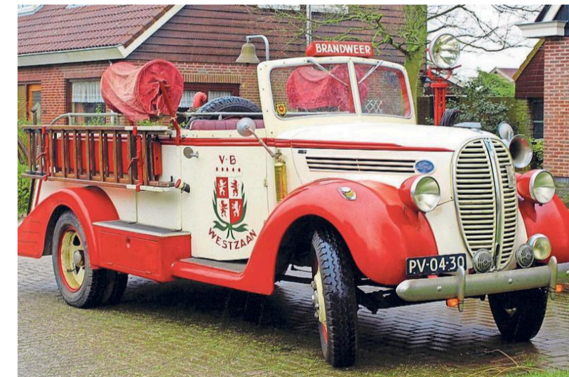
De Zuiderspuit, door de brandweer van Westzaan gekocht in 1938.

Ekko Vermeulen Stichting Zaanse Pakhuizen